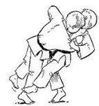
SASAE TSURI KOMI ASHI