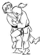
O SOTO GARI