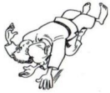
TATE SHIO GATAME