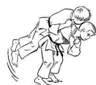
IPPON SEOI NAGE