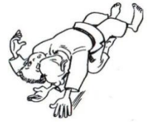
TATE SHIO GATAME

Exemple de retournements mais il y en a d'autres