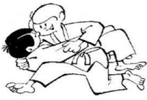
HON GESA GATAME