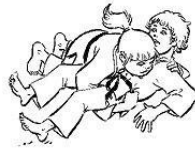
YOKO SHIO GATAME