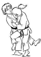
KO UCHI GARI