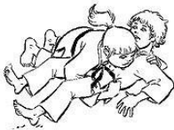
YOKO SHIHO GATAME