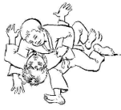
KUZURE GESA GATAME