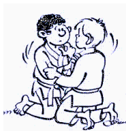
POSITION FACE-A- FACE A GENOUX